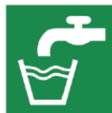
ponteggi senza l'utilizzo delle apposite scale E015 - Acqua potabile