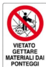
Vietato gettare materiali dai ponteggi