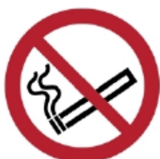
P002 - Vietato fumare