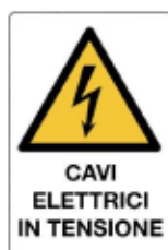
Cavi elettrici in tensione