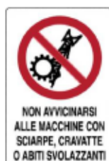
Vietato avvicinarsi alle macchine utensili con vestiti svolazzanti