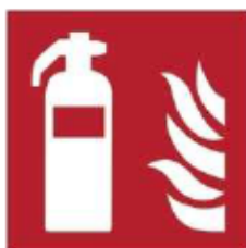
F001 - Estintore