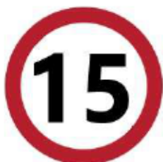
Velocità massima in cantiere di 15 km/h