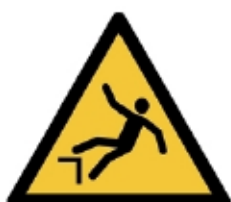
W008 - Caduta con dislivello