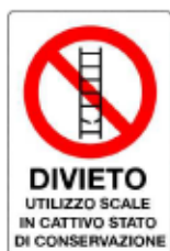
Divieto di utilizzo scale in cattivo stato di conservazione