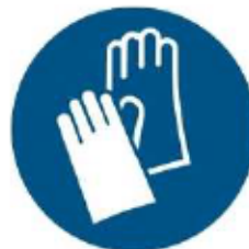
M009 - Indossare guanti protettivi