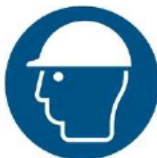
M014 - Indossare casco di protezione