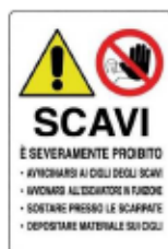
Divieto di accedere o sostare in prossimità di scavi