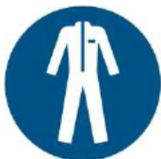
M010 - Indossare indumenti protettivi