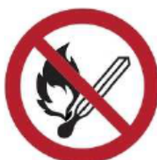
P003 - Vietato usare fiamme libere