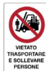
Vietato trasportare e sollevare persone