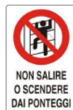
Vietato salire o scendere dai