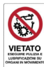
Vietato eseguire pulizia, riparazioni e lubrificazioni su organi in movimento