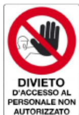
Divieto d'accesso al personale non autorizzato