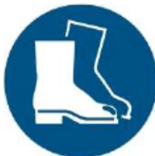
M008 - Indossare calzature di sicurezza