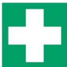
E003 - Pronto soccorso