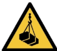
W015 - Carichi sospesi