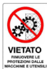
Vietato rimuovere le protezioni dalle macchine e utensili